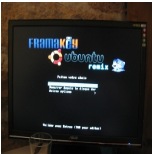
L'écran de boot de la clé