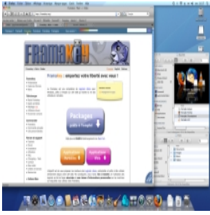
Framakey pour Mac