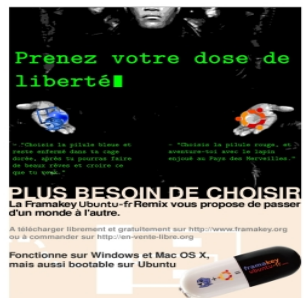
Le poster de promotion

Petite vidéo montrant les tout premiers tests avec Ubuntu dans VirtualBox portable (sans quitter Windows, donc). Cette démonstration est issue de l'article introduisant le projet.